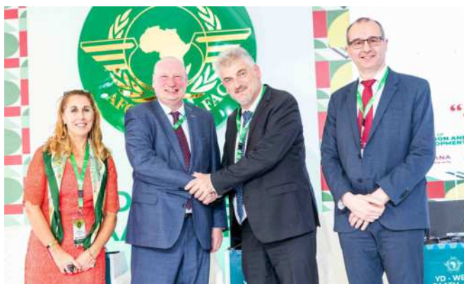
EU Delegates at the 24th YD Day celebration

The event further recommended the creation and enhancement of the capacity of civil aviation authorities to manage the liberalization process effectively through training of personnel, improving technical capabilities, and ensuring that the regulatory bodies have the expertise to oversee a more open and competitive market.