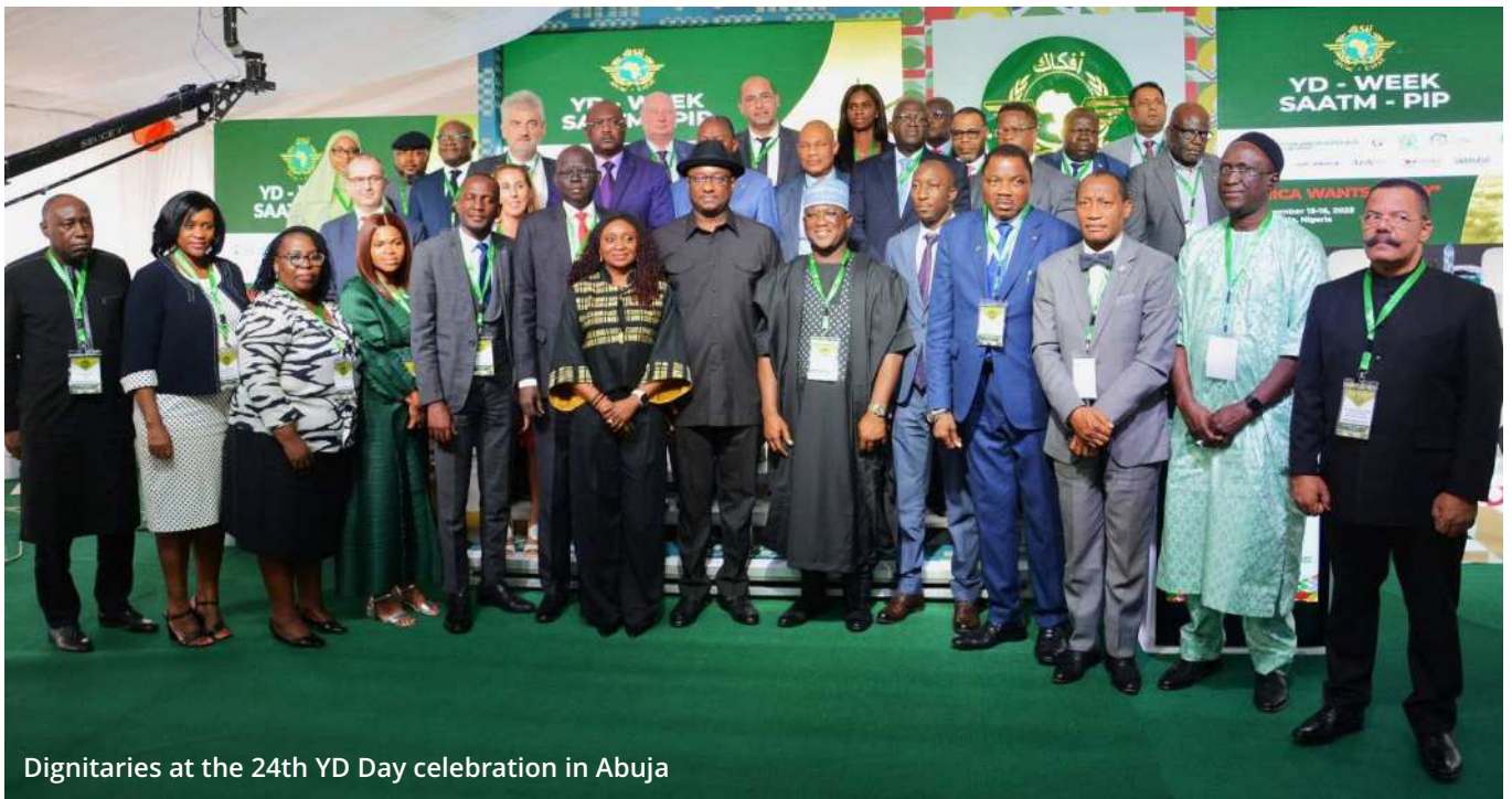
Dignitaries at the 24th YD Day celebration in Abuja

T he air transport industry in Africa is ending 2023 on a strong positive note with innovative recommendations by African Ministers of Aviation and Transport, international organizations, aviation partners and the African Civil Aviation Commission (AFCAC) to accelerate the liberalization of air transport in Africa through the full implementation of the Yamoussoukro Decision (YD) and the Single African Air Transport Market (SAATM). This is to promote economic growth, interconnectivity and regional integration in Africa.