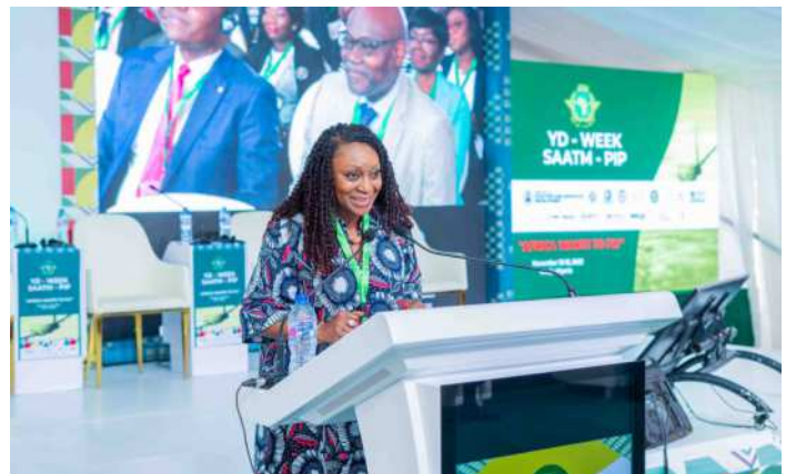
SG AFCAC Adefunke Adeyemi addressing African Ministers and stakeholders at the 24th YD Day celebrations in Abuja

It is encouraging that in 2022 and 2023, there has been a large growth in 5th freedom right granted scheduled capacity, 26% and 36% respectively, well above the growth trend during the past 10 years