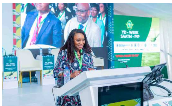
La SG CAFAC, Adefunke Adegemi s'adressant aux ministres africains et aux parties prenantes lors des célébrations de la 24ème Journée de la DY à Abuja.

Il est encourageant de constater qu'en 2022 et 2023, il y a eu une forte croissance de la capacité programmée accordée au titre du droit de 5ème liberté, de 26 % et 36 % respectivement, ce qui est bien supérieur à la tendance de la croissance observée au cours des dix dernières années