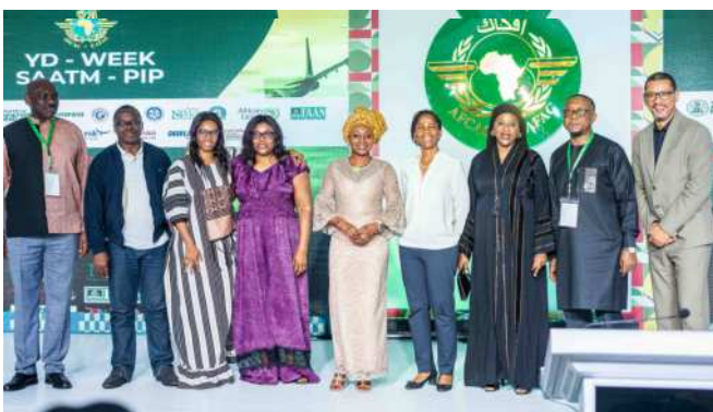
Des représentants de la CAFAC à la Soirée de Remise des Prix du SAATM lors de la 24ème Journée de la DY à Abuja