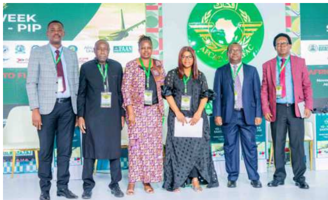
Discussants at the 24th YD Day ceremonies in Abuja