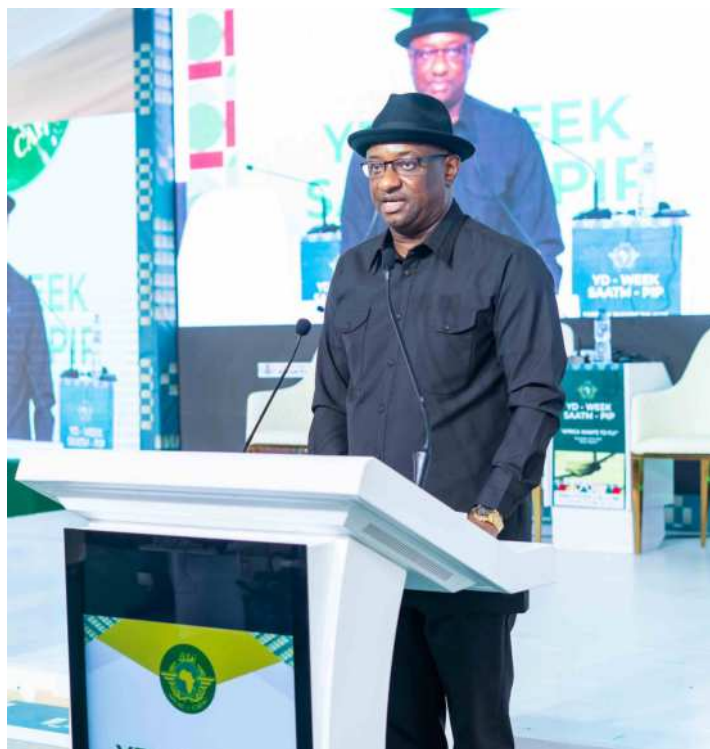
M. Festus Keyamo, ministre nigérian de l'Aviation et du Développement aérospatial, s'exprimant lors de la célébration de la 24ème Journée de la DY à Abuja

Par ailleurs, le ministre a déclaré que le thème de la Journée DY 2023, " L'Afrique veut voler ", est, en effet, le reflet d'un désir profond ancré dans le cœur d'innombrables Africains. " À l'heure actuelle, le commerce intra-africain ne représente que 14,4 % du total des exportations africaines. Bien que les compagnies aériennes africaines aient enregistré une hausse de 34,7 % du trafic de passagers au cours de l'année écoulée, la part du continent sur le marché mondial des passagers reste modeste (2,1 %). Par conséquent, le marché unique du transport aérien africain (SAATM / MUTAA) est une évidence non seulement pour donner un élan au commerce intra-africain et au tourisme, mais aussi, pour réduire de 51 % le déficit commercial du continent", a-t-il ajouté. 🌍