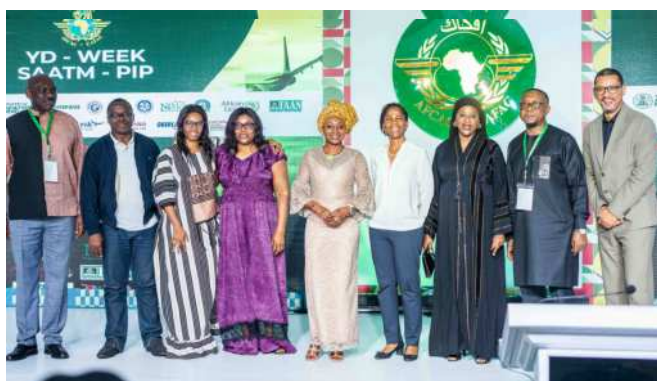
AFCAC officials at the SAATM Award Night 24th YD Day event