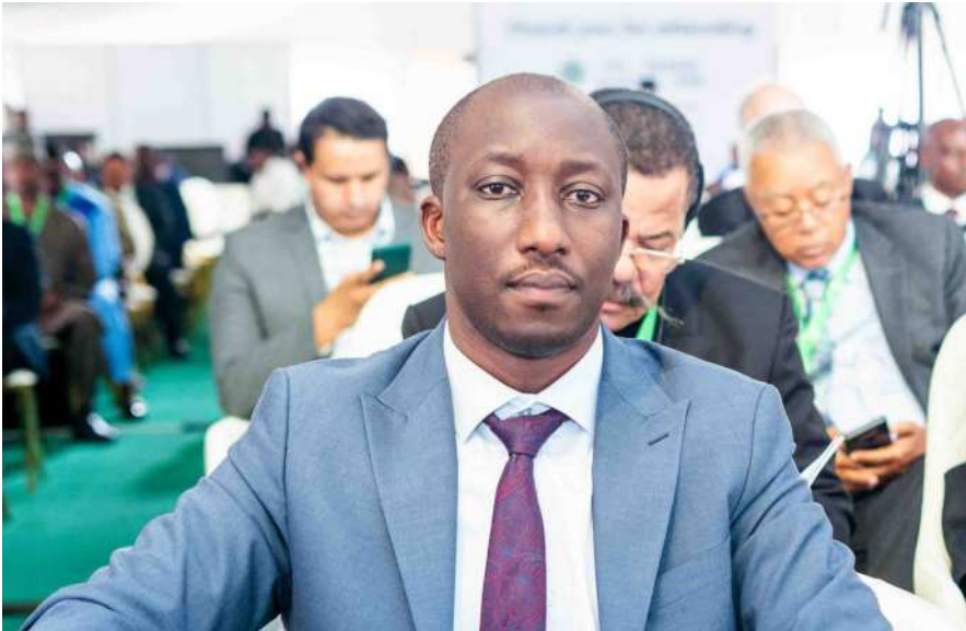
Minister of Infrastructure of Rwanda, Dr. Jimmy Gasore at the 24th YD Day in Abuja

T he Minister of Infrastructure of Rwanda, Dr. Jimmy Gasore, has said that, for the African Continental Free Trade Area (AFCFTA) to be successful, "Africa needs to prioritize aviation to ease the movement of persons and goods across the continent." He said Rwanda has removed visas for all Africans and is ready to sign liberalised air transport agreements with any African States under the Single African Air Transport Market (SAATM). Dr. Gasore spoke at the 24th YD Day Anniversary with the theme "Africa Wants to Fly" He said: "African States need to celebrate the removal of visas amongst ourselves. Business needs unrestricted movement of persons and goods, we can be the starting point."