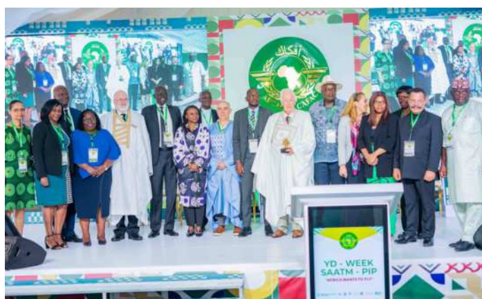
Délégués distingués promouvant la culture vestimentaire africaine lors de la 24ème Journée de la DY à Abuja

de l'UA afin d'accroître la sensibilisation et le soutien politiques. La domestication et l'harmonisation des réglementations En tant que fondement d'une mise en œuvre durable du SAATM, la Semaine de la DY a recommandé que la domestication et l'harmonisation du cadre réglementaire de l'aviation dans les pays africains garantissent que tous les opérateurs sont régis par des réglementations normalisées, cohérentes et transparentes qui créent un environnement propice aux compagnies aériennes pour opérer de manière transparente sur le marché intra-africain.