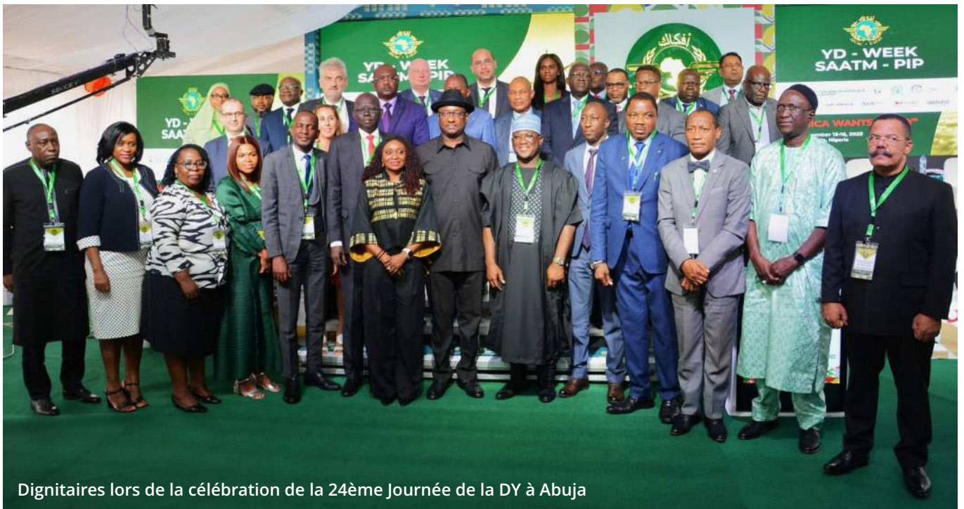
Dignitaires lors de la célébration de la 24ème Journée de la DY à Abuja

Les ministres africains, les organisations internationales et les parties prenantes écommandent des stratégies pour accélérer la mise en œuvre du MUTAA/SAATM