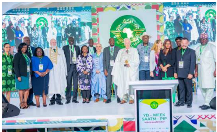
Distinguished delegates promoting African costume culture at the 24th YD Day in Abuja