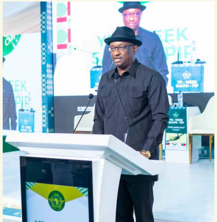
Mr. Festus Keyamo, Nigeria's Minister of Aviation and Aerospace Development addressing African Ministers and delegates at the 24th YD Day in Abuja

He said that the theme of the 2023 YD-Day, "Africa Wants to Fly" is a reflection of a profound desire deeply rooted in the hearts of countless Africans. "Presently, intra-Africa trade stands low at just 14.4% of total African exports. Though African airlines have recorded a 34.7% surge in passenger traffic over the past year, the continent's global passenger market share remains modest at 2.1%. Therefore, the Single African Air Transport Market (SAATM) is a no-brainer in giving impetus to not just intra Africa trade, tourism, but SAATM would also reduce the continent's trade deficit by 51%," he submitted. 🇳🇬